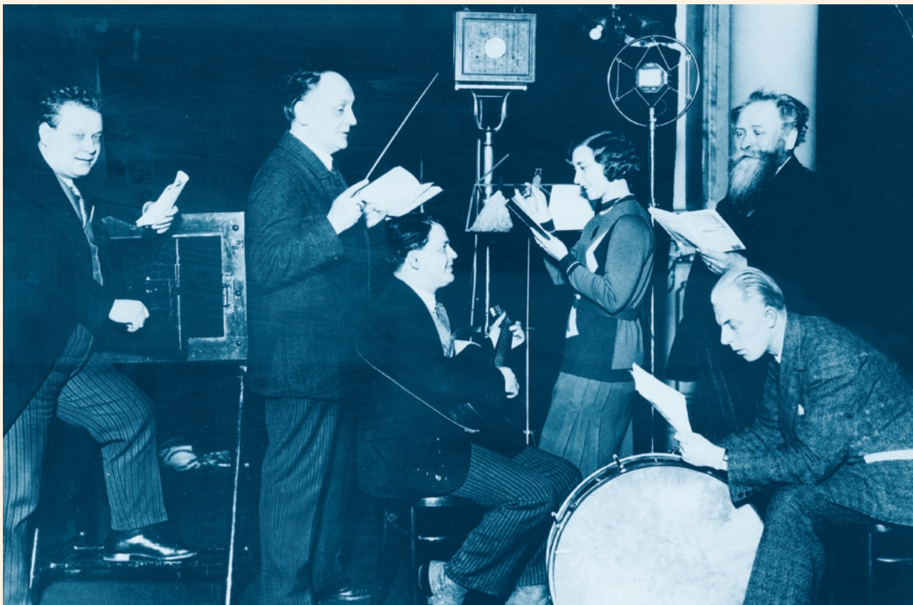
Soubor loutkové scény Umělecká výchova při vysílání hry pro děti Divoký lovec (1931)

že nesdílelo (kromě pokusného ověřování technických možností před zahájením ve Kbelích) praxi evropských stanic s bohatým (někdy téměř výhradním) zařazováním gramodesek s nabídkou dobových šlágrů; vzdor všem technickým nesnázám zavedlo napřed koncertní pořady populární hudby, rozšířilo je k hudbě vážné a teprve potom doplňovalo nabídku o hudbu ryze zábavnou, také o pořady z gramofonových desek. Radiojournal se snažil nabídnout posluchačům, co potřebují, nikoli co právě chtějí. Velmi zásadově o to usilovala především stanice brněnská. S růstem posluchačského okruhu přirozeně narůstal proces zlidovění rozhlasového programu, ale byl spojován důsledně s výchovou kulturního posluchače.