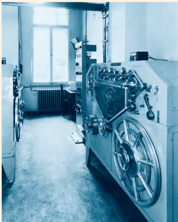
Blattnerphon, stroj pro záznam zvuku na ocelový pás (1939)

nahrát, potom se nahrál záznam, který se po vychladnutí přehrával speciální přenoskou. Vzhledem k rychlému opotřebování drážky byla deska použitelná v dobré kvalitě jen jednou. Později bylo užito vosku s přísadou pryskyřice (hovoří se o výrobě „z vosku a pryskyřic“), to už byl materiál daleko trvanlivější. (V brusírně vosků byly desky ohlazeny pro další užití.) Šéfredaktor Václav Sommer v roce 1939 konstatoval, že „mluvené slovo zní s voskové desky velmi dobře, bylo by dobře experimentovati s natáčením menších her na vosk, protože technické zařízení nyníjší to dovoluje.“ 47 Zároveň se začalo nahrávat do povlakové desky s želatinovým povrchem, později naneseným na hliníkovou fólii („povlaková deska má účinnou vrstvu ze speciálního laku nebo želatiny, nanesenou na nosný, tuhý podklad“ 48 ), z níž se snímal zvuk speciální plochou zahnutou jehlou ze standardního gramofonu s přenoskou na výměnné