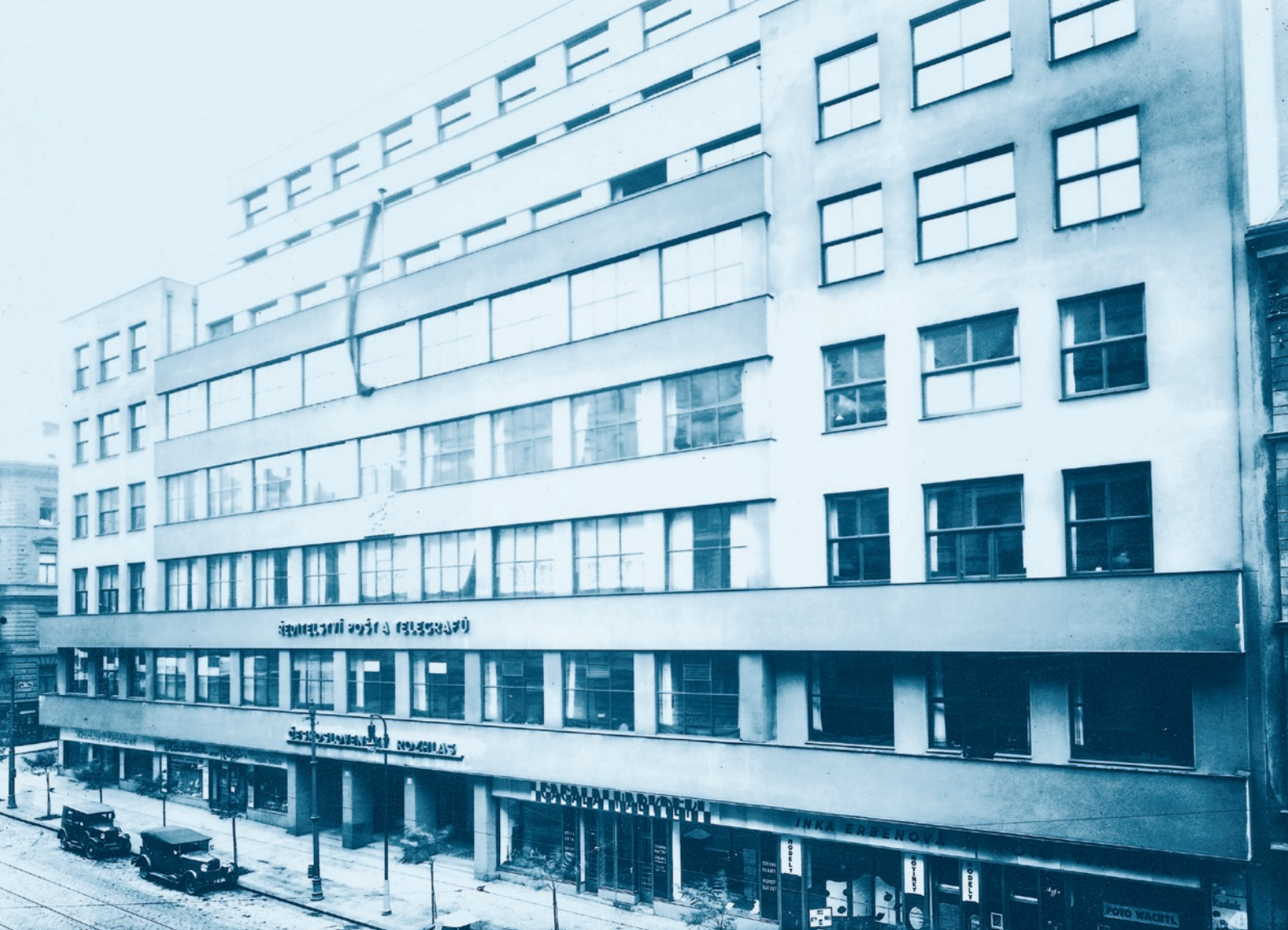
Sídlo Radiojournalu v budově pražského ředitelství pošt, Fochova, dnes Vinohradská 12 (1933)