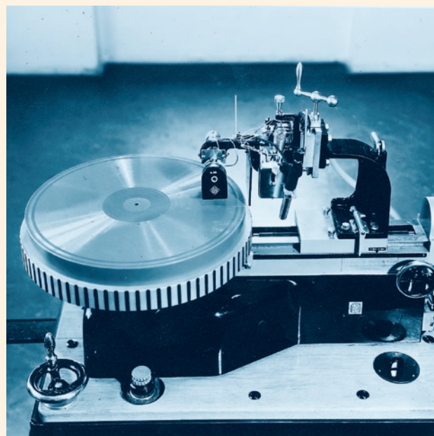
Stroj pro záznam zvuku na voskové desky (1939)

jehly. Desky byly určeny především k archivním účelům. Sommer 49 je považoval za velmi významné pro zvukovou kulisu v rozhlasových hrách (ale s počátkem okupace se zhoršila kvalita jejich materiálu).