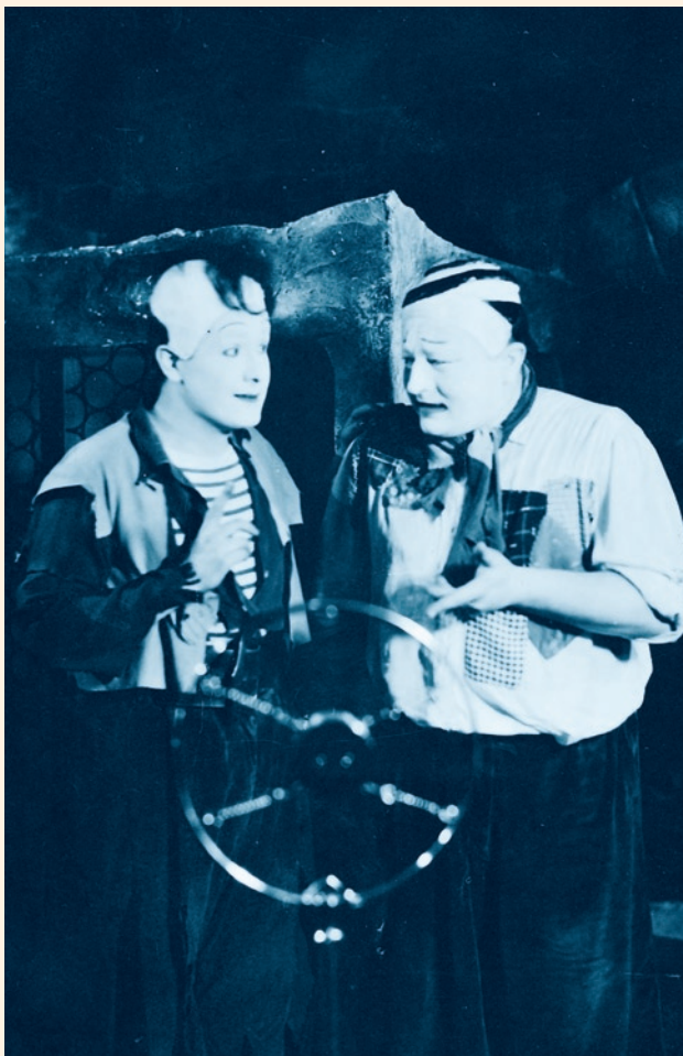
V + W při přenosu Balady z hadrů , Spoutané divadlo (1936)

Bez obtíží a s velkým ohlasem byly realizovány dramatizace, jako byla vedle Kožíkova Čapka (První party) například Müllerova–Jiráskova Filosofská historie .