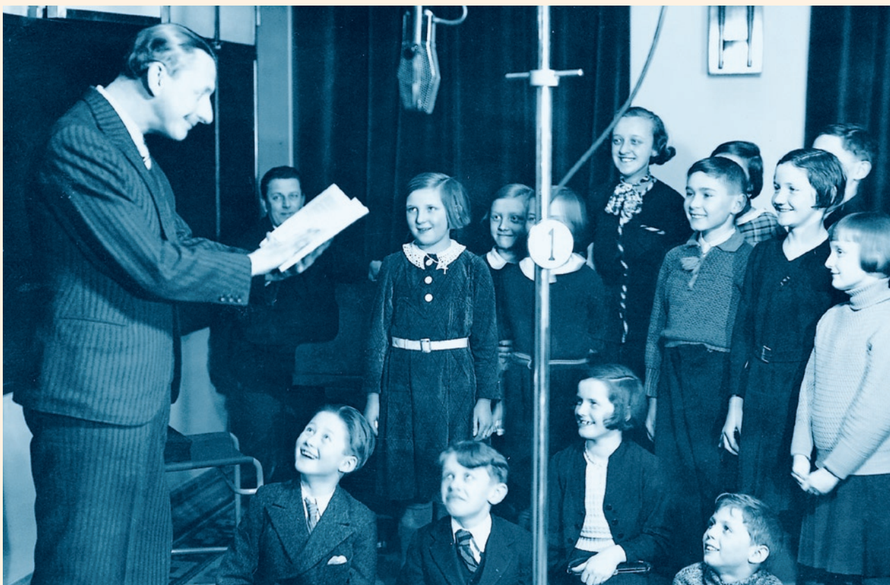
Vlasta Burian v dětské besídce 1935

propagandisticky k popularizaci masarykovského humanismu a jeho výkladu myšlenek demokracie.“ 151