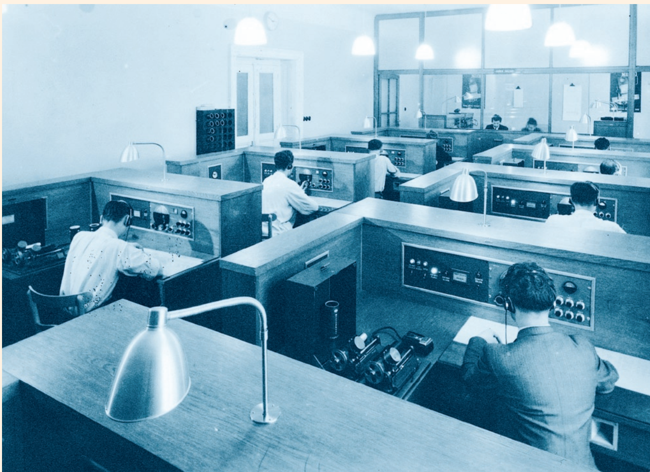
Pracoviště odposlechové služby (1948)