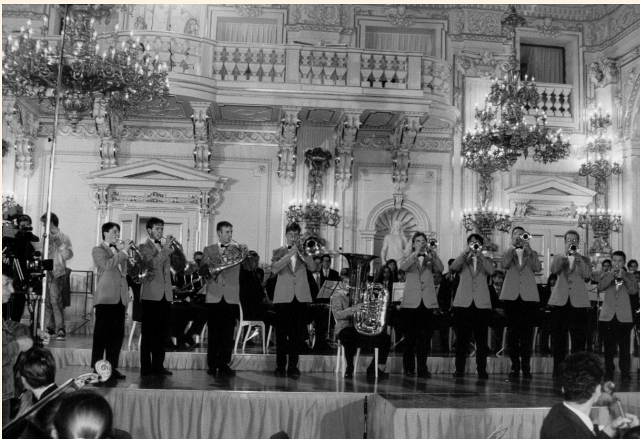
Žestový soubor Základní umělecké školy v Náchodě při Slavnostním koncertu vítězů Concerto Bohemia ve Španělském sále (1996)