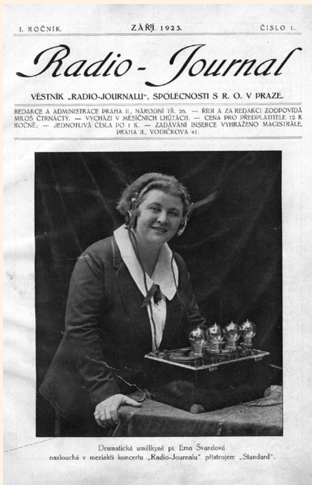
První číslo programového věstníku

„Zahajujeme dnešním číslem vydávání časopisu, jehož účelem je především, aby sloužil k informaci těch, kdo stali se předplatiteli Radiojournalu, t.j. jeho bezdrátových produkcí a zpráv, a v druhé řadě pak k poučení všech, kdo se o radio zajímají.“ Těmito slovy v září roku 1923, pouhé čtyři měsíce od počátku pravidelného domácího radiofonního vysílání ze kbelského stanu, zahájila redakce věstníku Radio(-)journal, řízená