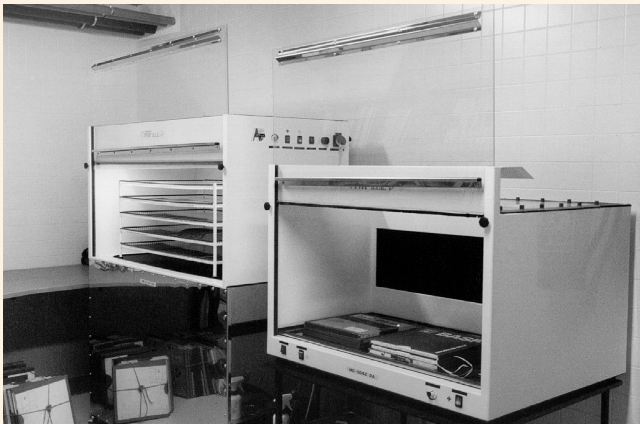
Dezinfekční komora pro mechanickou i chemickou očistu dokumentů

Gramoarchiv začal vznikat shromažďováním nahrávek, zpočátku výhradně cizích, nejdříve s díly klasické, později i zábavné a taneční hudby.