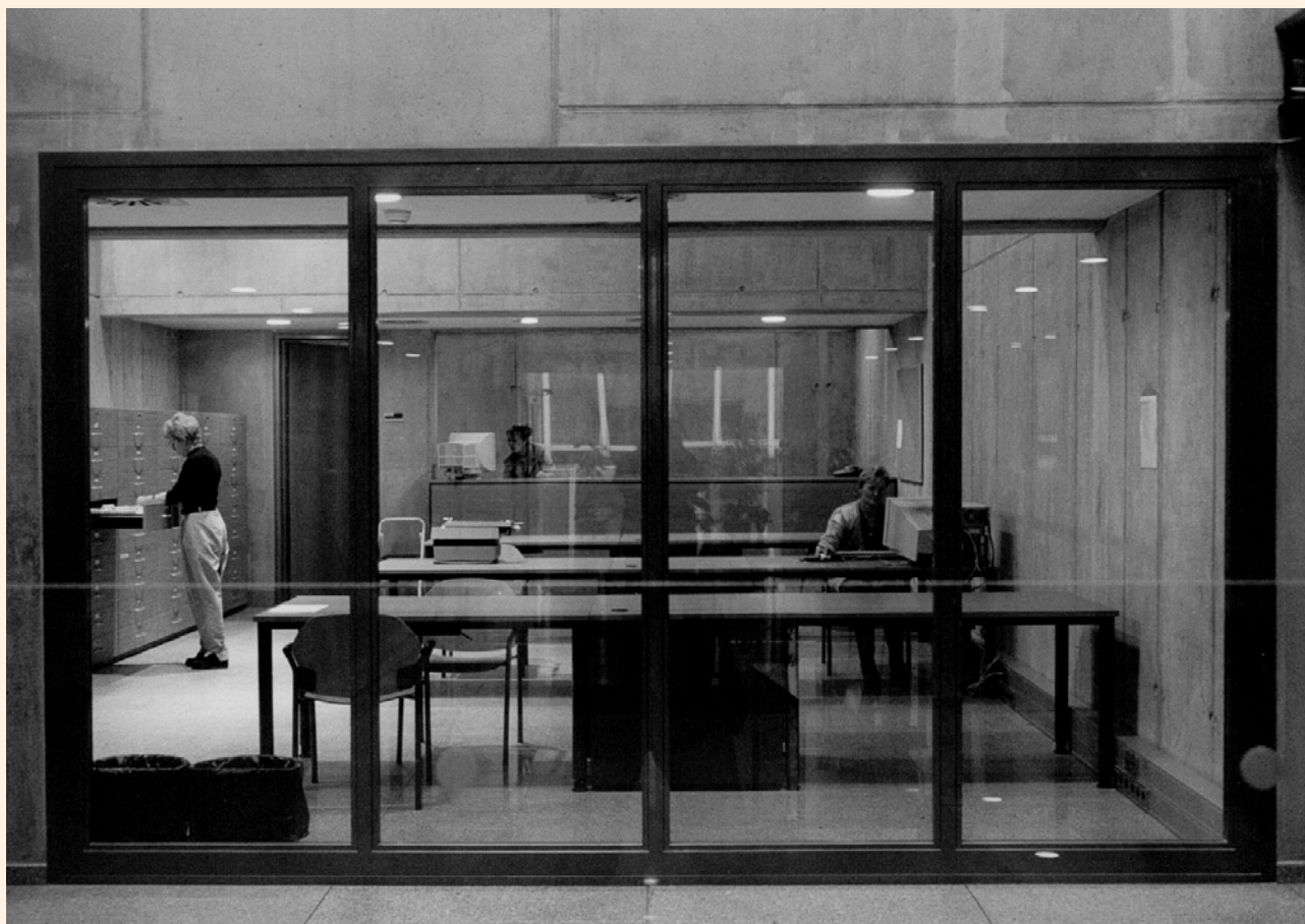
Badatelna Českého rozhlasu (poskytuje služby i veřejnosti)

Na přelomu let 1927–1928 začal slovesný odbor Radiojournalu shromažďovat písemné programové materiály ve dvou samostatných řadách – hry a přednášky. Od dubna 1941 se přednášky svazovaly do tzv. deníčků. Samostatnou numerickou řadu tvoří větší programové celky – hry, pásma apod. Archiv vedle dokumentů programového charakteru uchovává i materiály správní a fotosbíрку.