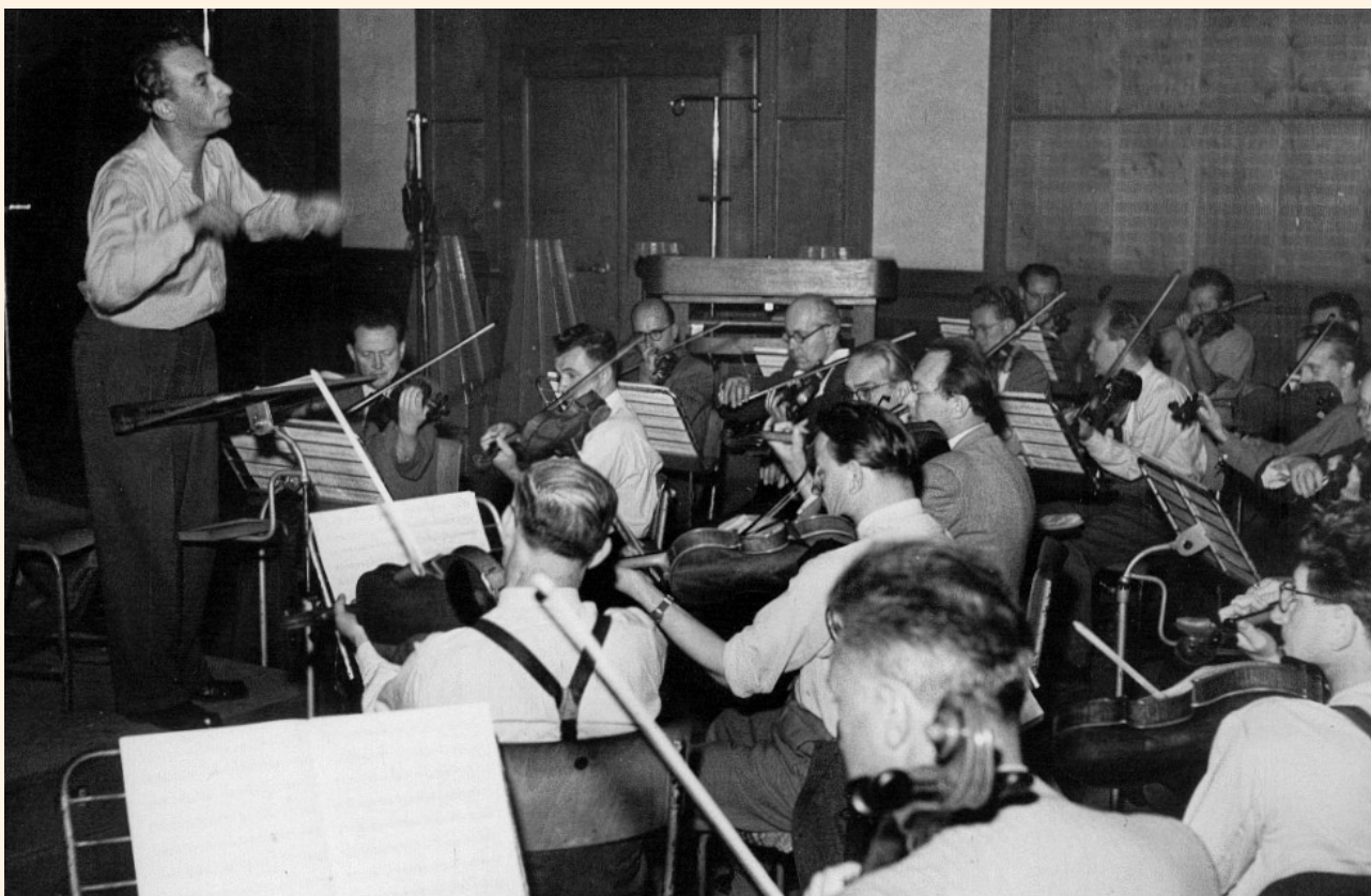
Šéf rozhlasových symfoniků K. Ančerl (1949)