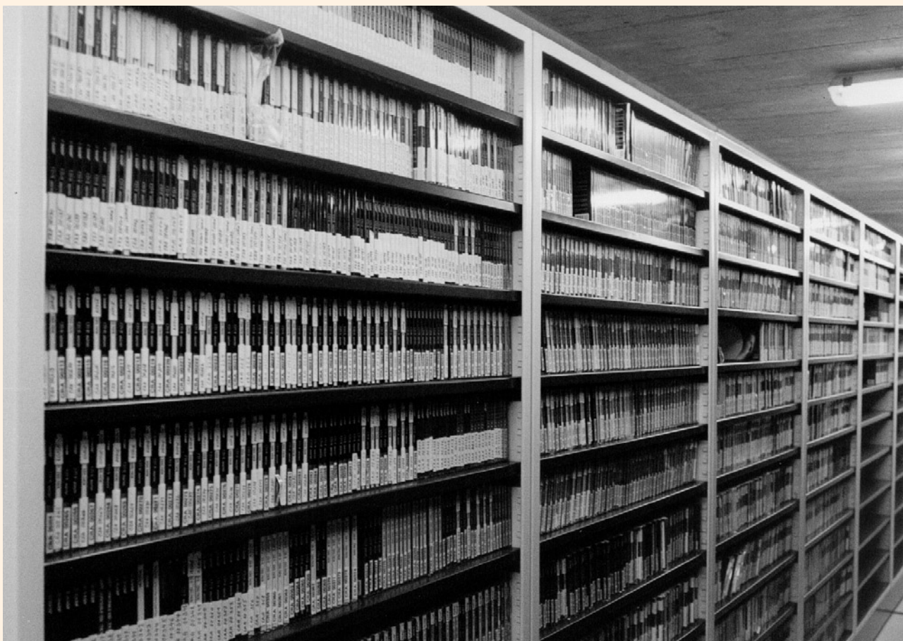
Depozitář zvukových snímků

Rok 2000 znamenal konec prostorových provizorií, APF se s výjimkou dokumentace přestěhovaly do nových účelově vybudovaných prostor studiového domu v Římské ulici na Vinohradech.