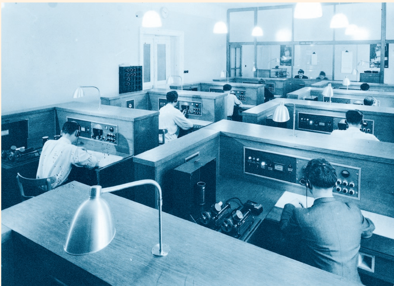
Pracoviště odposlechové služby (1948)