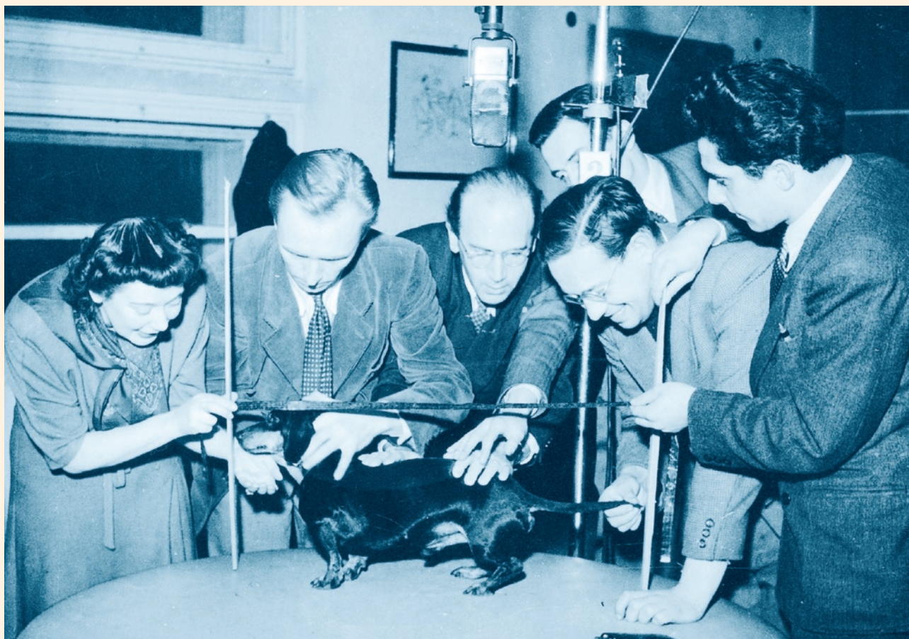
Beseda Rozhlasových novin (1948)

dny vysílání pro venkov, na Praze I se vysílalo osidlovací zpravodajství, které vysílaly též Plzeň, České Budějovice a Východočeský vysílač. Slovensko vysílalo své vlastní Rozhlasové noviny, ostatní stanice s výjimkou Brna II do 19.45 hod. přejímaly program Prahy I, od 19.45 hod. navazovaly vlastním zpravodajstvím – Hlas Moravy (Brno), Rozhlasový deník Ostravska, Západočeské rozhlasové noviny a Jihočeské rozhlasové noviny. Tento stav byl odsouhlasen i programovou konferencí ve Zlíně.