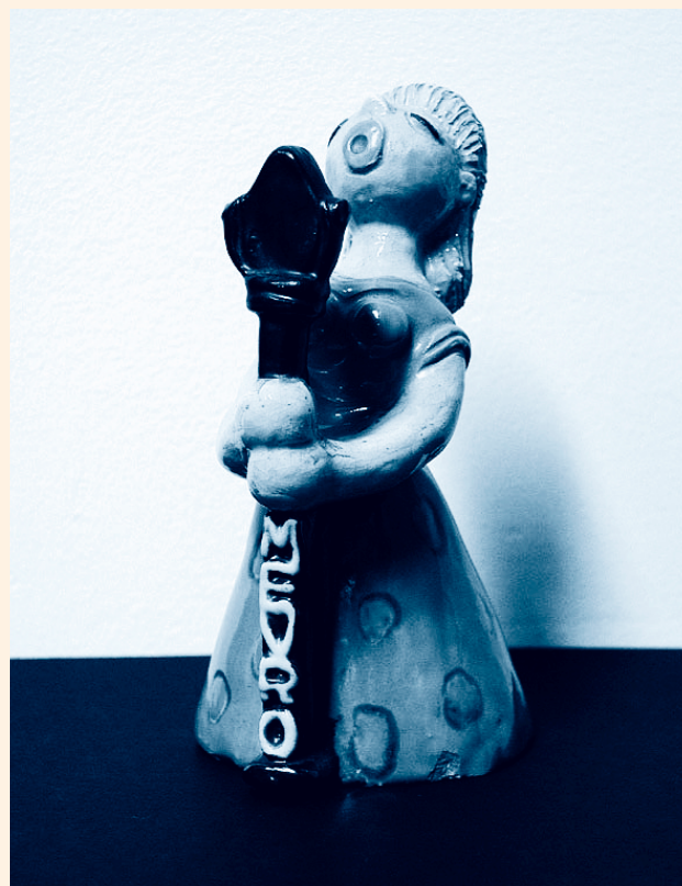
Soška Mevrušky vytvořená Janem Kutálkem

Výstavu za osm týdnů (15. května–11. července) navštívilo přes 315 000 návštěvníků , rozhlas obdržel 20 000 dopisů posluchačů. Poslechovost vysílání z výstaviště přesáhla poslech běžných stanic s výjimkou Prahy I, mezi 8.30–19.00 hod. dosahovala 47 %. Dopisy posluchačů reagujících na rozhlasovou kvalitu programu dokazovaly, že MEVRO bylo záležitostí nejen vizuální. J. Kolář tuto skutečnost okomentoval slovy: „ Rozhlas