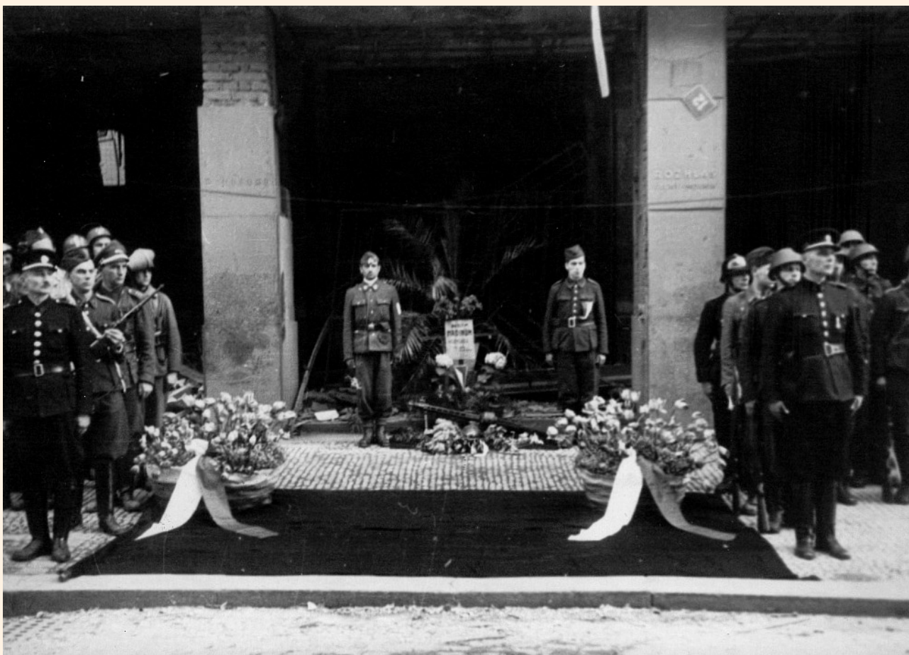
Smuteční tryzna u budovy rozhlasu 11. 5. 1945