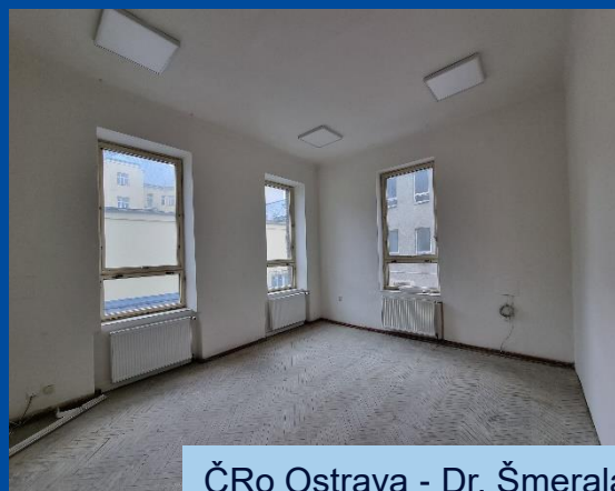
ČRo Ostrava - Dr. Šmerala 6