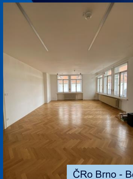
ČRo Brno - Beethovenova 4