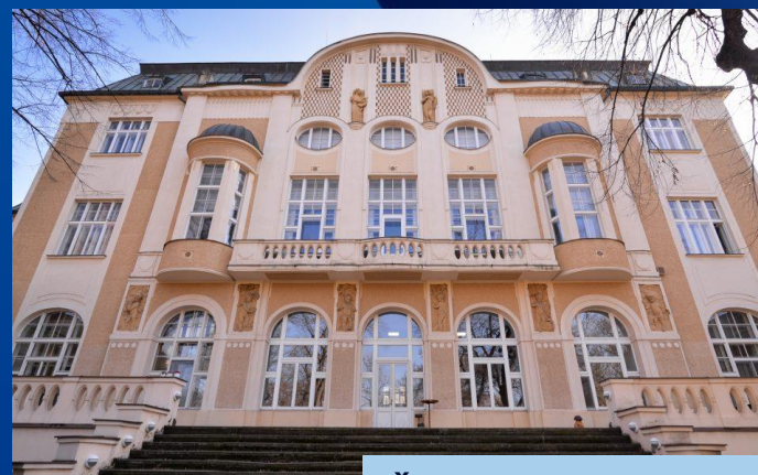
ČRo Praha – Karlín