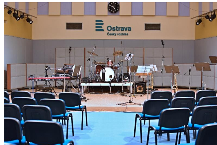
Český rozhlas Ostrava – Studio 1 | foto: František Tichý

Rádio zpravodajství, aktuální publicistiky, užitečných informací a hudby.