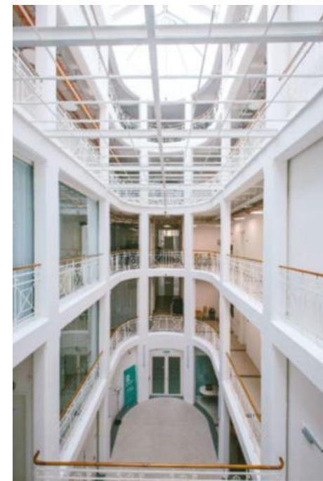
Český rozhlas Olomouc

Nezávislé, užitečné, důvěryhodné, aktuální, moderní.