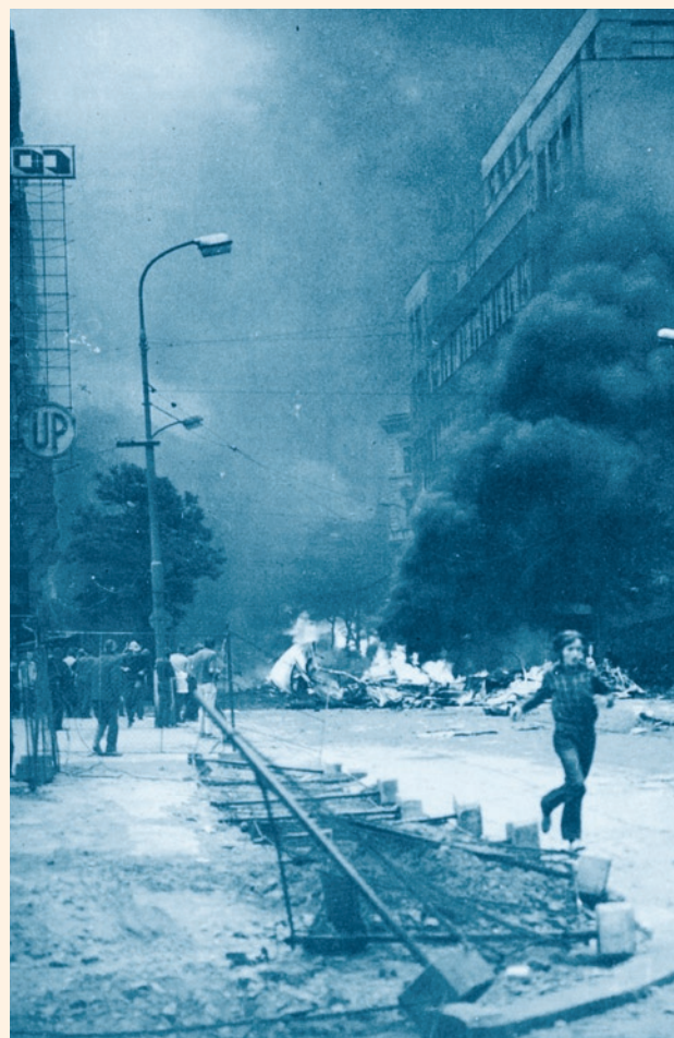
21. 8. 1968 před budovou pražského rozhlasu

Před 7.00 hod. se ruské tanky – po peripetii na horním konci Václavského náměstí, kde vojáci rozstříleli fasádu Národního muzea v domněni, že útočí na rozhlas – pomalu sunuly k rozhlasové budově. V postupu jim bránil