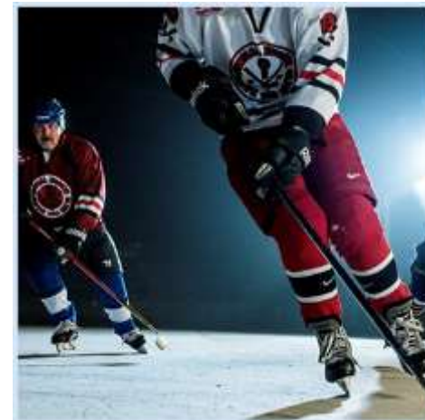
ilustrační foto

Nejdůležitější sportovní události přímo z míst jednotlivých akcí doma i ve světě.