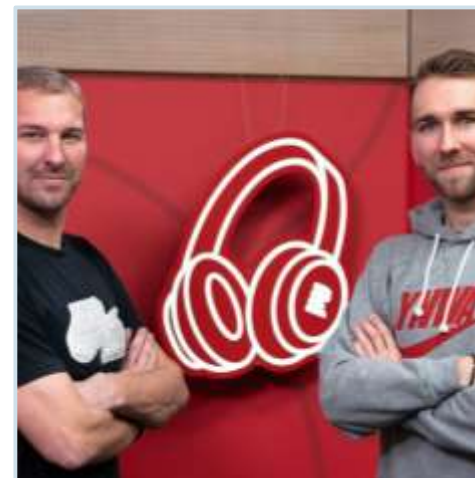
ilustrační foto

Každé pondělí před víkendem Vám nabízíme to nejzajímavější z anglického fotbalu.