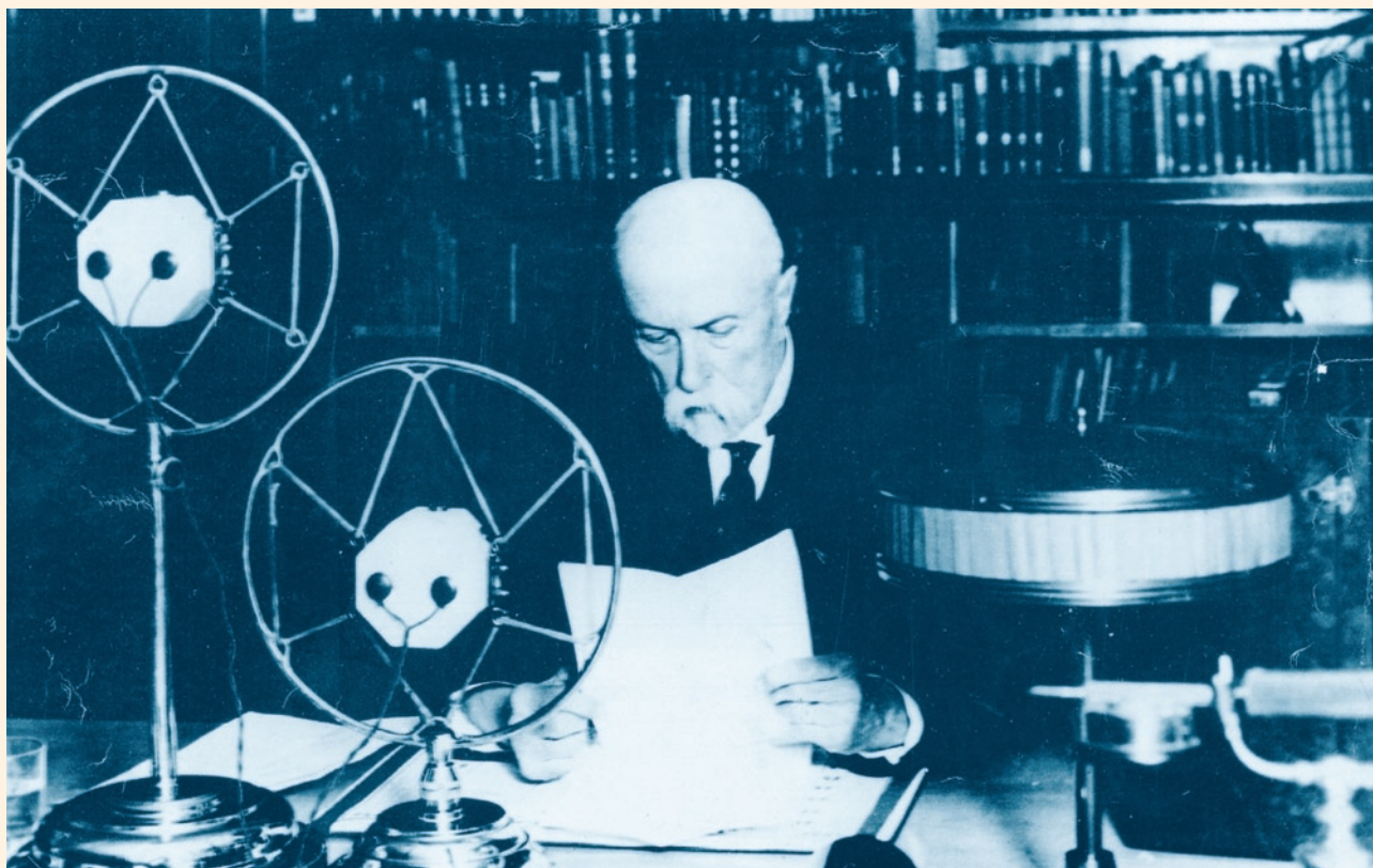
Prezident TG. Masaryk při projevu kamerickým posluchačům