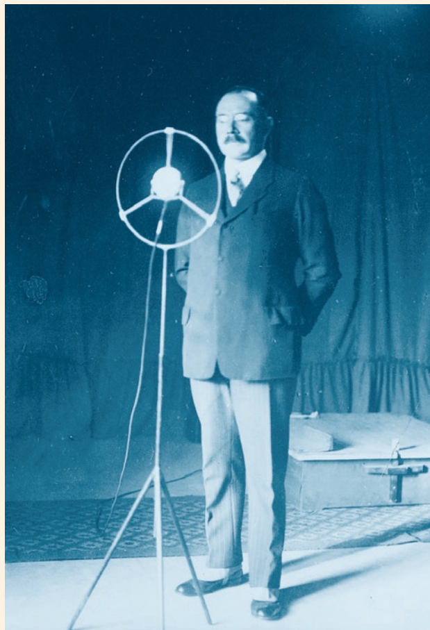
Ministr M. Hodža

Půl roku poté, co do rozhlasové společnosti vstoupil jako hlavní podílník stát, si vlivná politická síla – agrární strana – vydobyla vcelku bez větších problémů svůj „rozhlas v rozhlasu“, který postupně „nevtíravě a skrytě“ zpracovával veřejné mínění, a to zcela nezávisle na vedení Radiojournalu. Ten pro potřeby zemědělského rozhlasu poskytoval pouze vysílací čas, technická zařízení, studia a zajišťoval vysílání jeho programu.