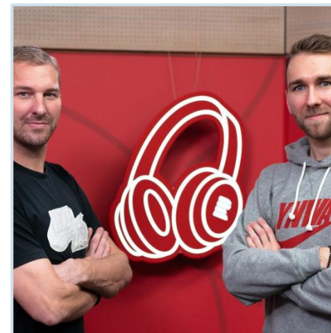
ilustrační foto

Každé pondělí před víkendem Vám nabízíme to nejzajímavější z anglického fotbalu.