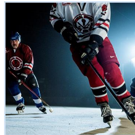
ilustrační foto

Nejdůležitější sportovní události přímo z míst jednotlivých akcí doma i ve světě.