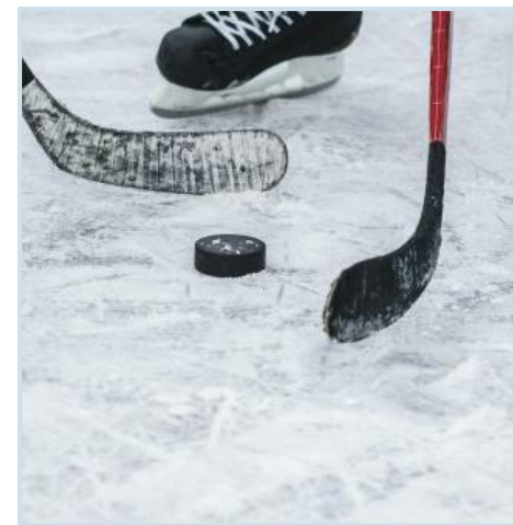
ilustrační foto

Reportéři Radiožurnálu Sport přímo na místě sledují fotbalové či hokejové zápasy nebo turnaje v dalších sportech a v živých vstupech komentují aktuální vývoj.