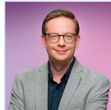
Aleš Cibulka

Zábavná živě vysílaná talkshow Aleše Cibulky. Pořad, ve kterém se o známých lidech dozvíte to, co jste ještě nevěděli. Přímo z jejich úst. Anebo díky němu objevíte nové zajímavé osobnosti. Pořad připomíná taky významná, zapomenutá i absurdní výročí.