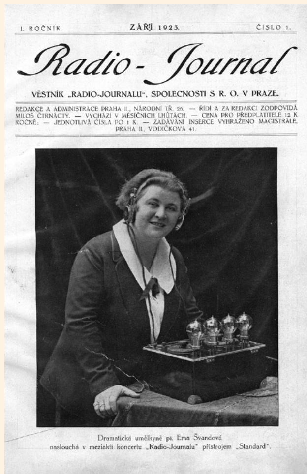
První číslo programového věstníku

„Zahajujeme dnešním číslem vydávání časopisu, jehož účelem je především, aby sloužil k informaci těch, kdo stali se předplatiteli Radiojournalu, t.j. jeho bezdrátových produkcí a zpráv, a v druhé řadě pak k poučení všech, kdo se o radio zajímají.“ Těmito slovy v září roku 1923, pouhé čtyři měsíce od počátku pravidelného domácího radiofonního vysílání ze kbelského stanu, zahájila redakce věstníku Radio(-)journal, řízená