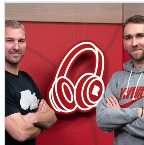
ilustrační foto